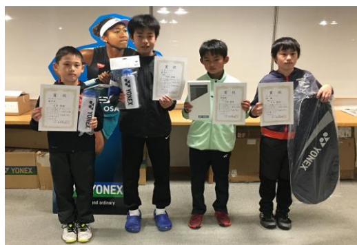
U12男子シングルス 入賞者