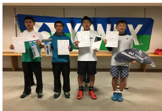
U14男子シングルス 入賞者