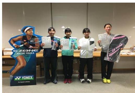
U14女子シングルス 入賞者