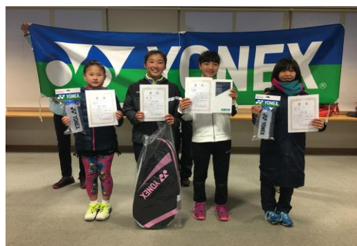
U12女子シングルス 入賞者