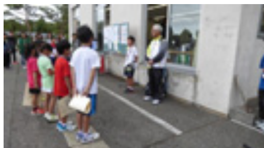
チャンピオンスピーチ