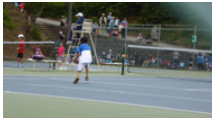
オレンジボール(ハード3面)