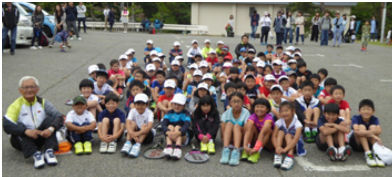
2018. 6. 16 小松市木場潟研修センターテニスコート