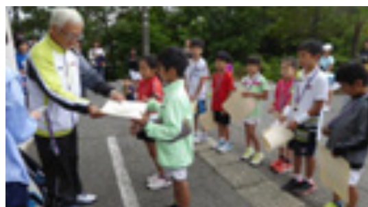
表彰式(メダルと賞状)