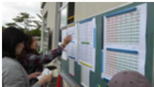
お母さんたちが運営のお手伝い