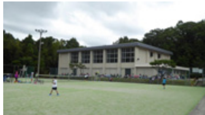
グリーンボール(人工芝4面)