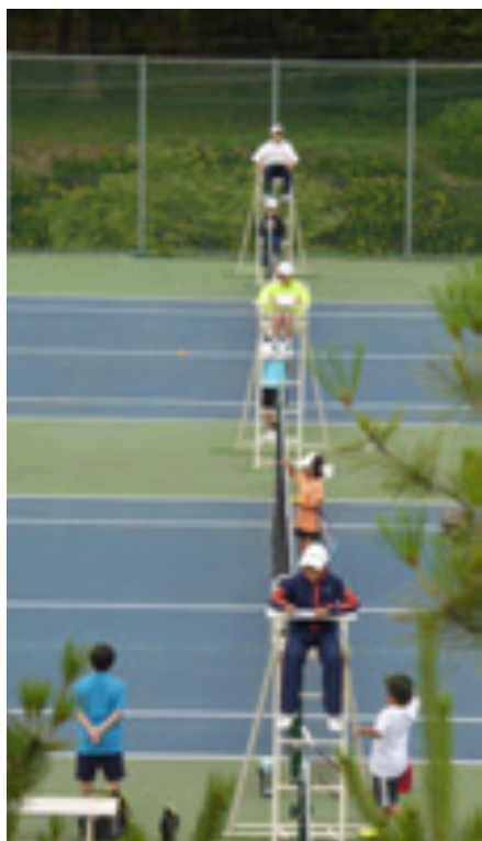
先輩たちがアンパイアをつとめた