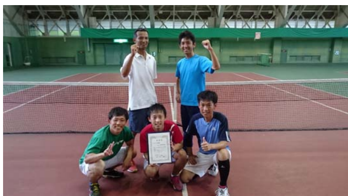
II 部優勝 金沢市役所A