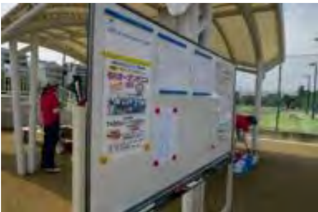
インフォメーションボード