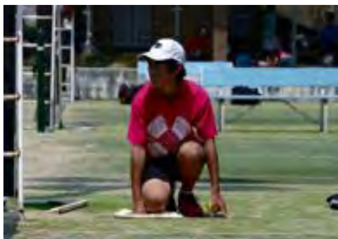
真剣なまなざしのボールパーソン