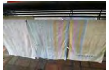
準備開始。濡れたベンチを拭くのもロービングアンパイアの重要な仕事。