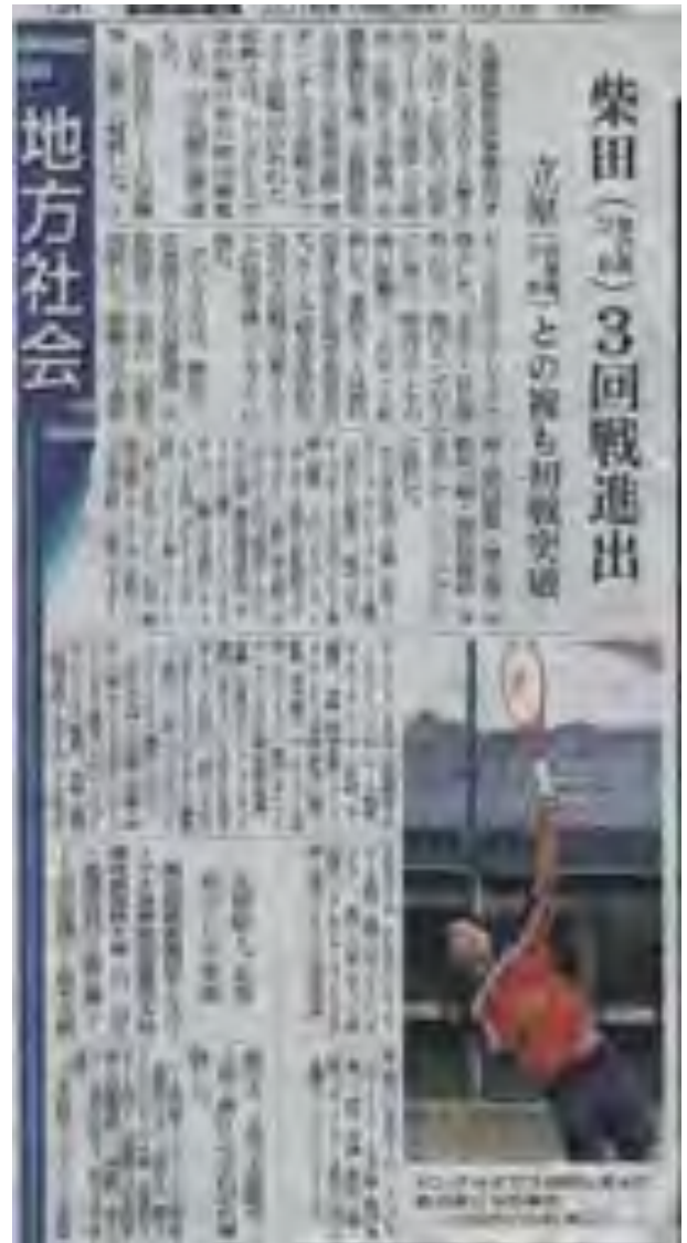
北國新聞社 27日(水)朝刊