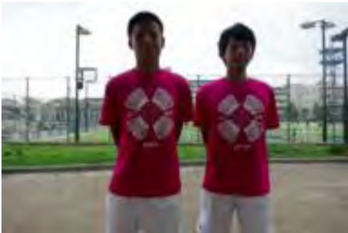
今年のTシャツはピンク