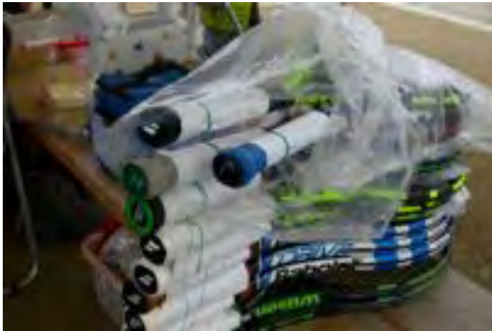
ガット張りの注文が次々と