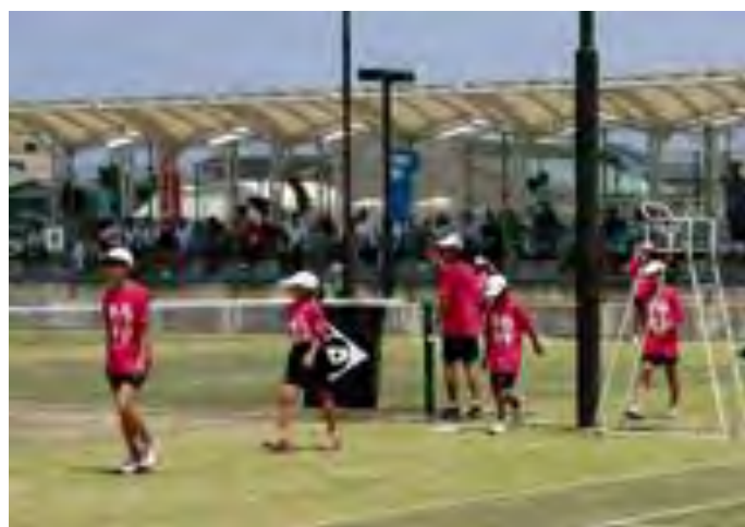
ボールパーソンの交代