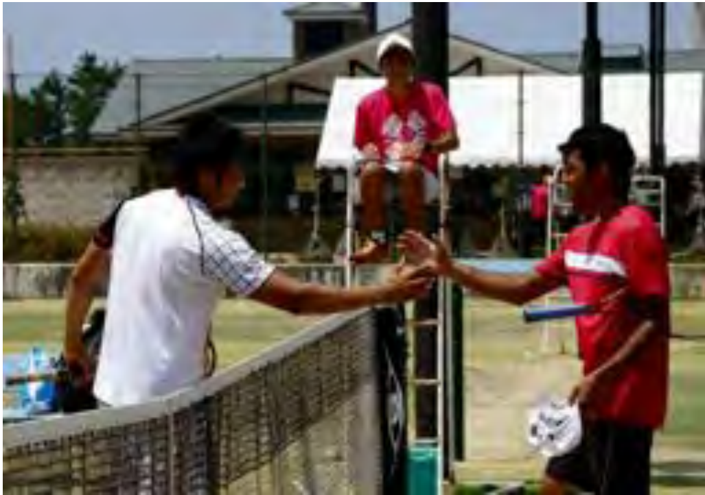
ゲームセット。互いの健闘を讃え合う、爽やかな笑顔