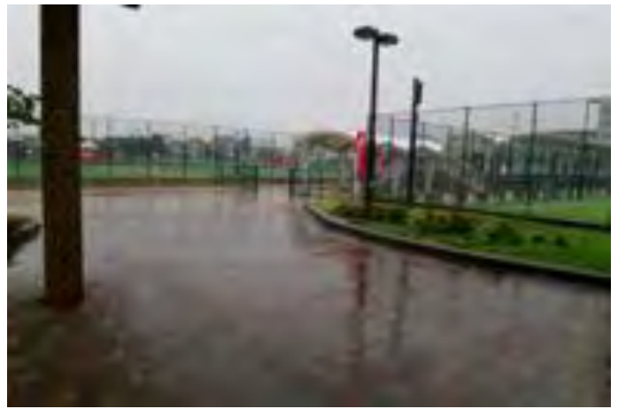
早朝からの雨。START AT は 11時30分に決定