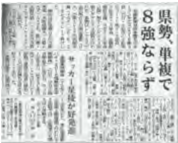
北國新聞社 28日(火)朝刊