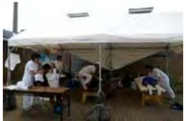
今年も吉田整体院の方々が選手の体のケアをして下さった