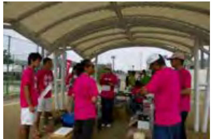
レフェリーミーティング