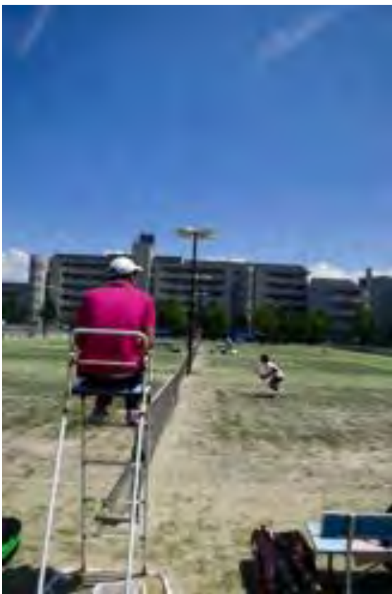
準決勝からはソロチェアアンパイアに