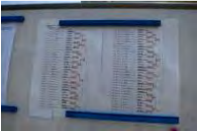
強豪がシングルスベスト8に進んだ