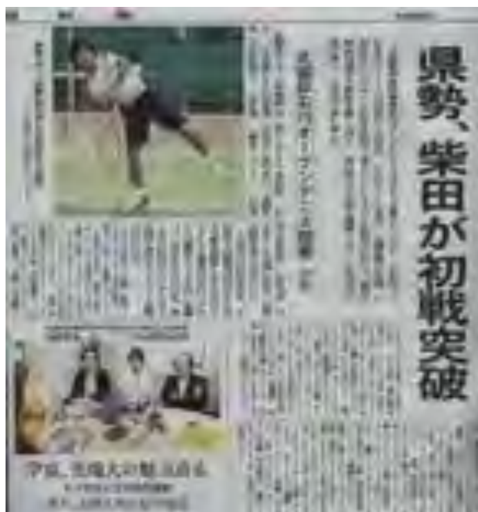
北國新聞社 26日（火）朝刊