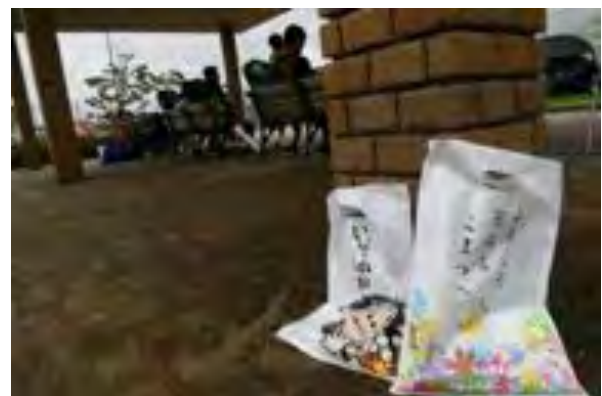
小松市の紹介パンフレット (いよっ 小松)