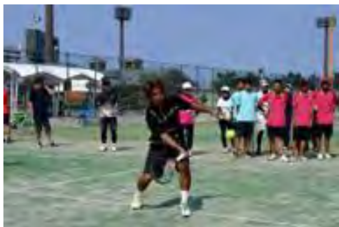
久松亮太プロからボレーを学んだ（クリニックにて）