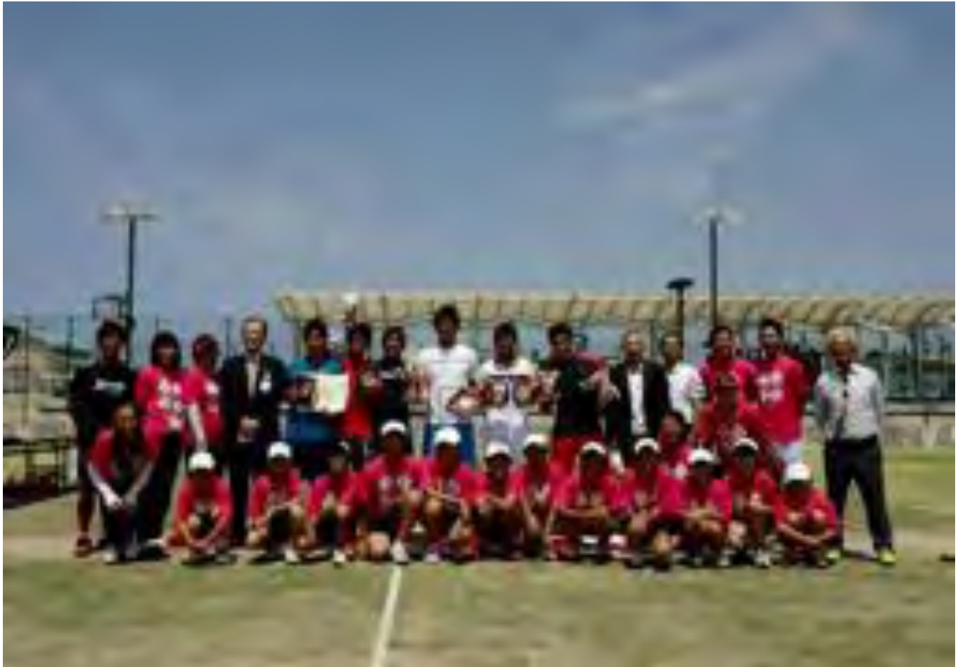
笑顔の表彰式 2016/07/30 小松市S・フォーティーンコート