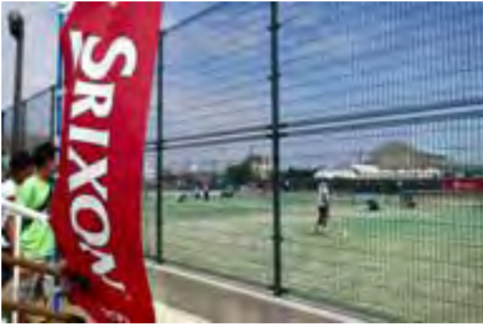
シングルス1回戦の熱戦が繰り広げられた。