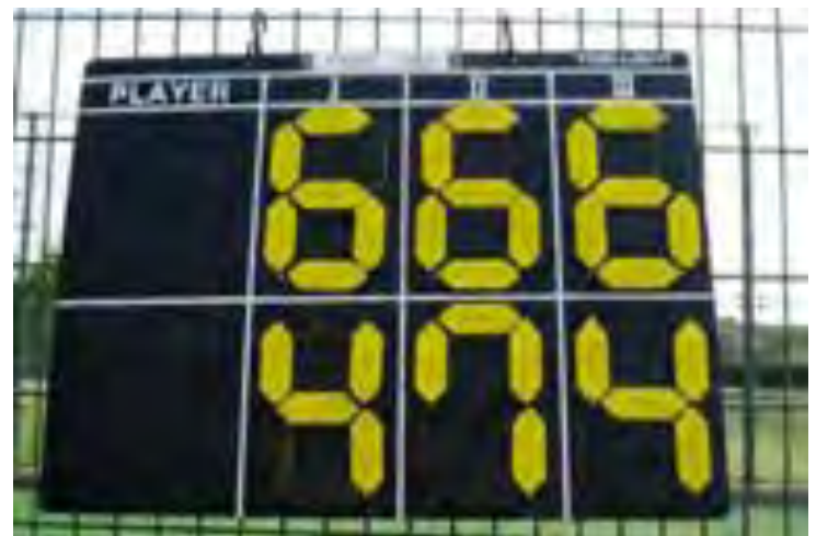
ダブルス最長試合は3時間15分