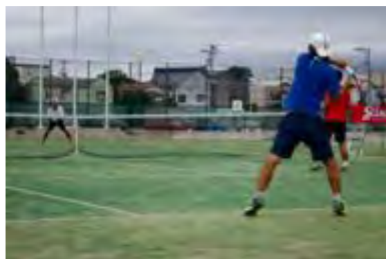
シングルス2回戦・ダブルス1回戦が行われた。