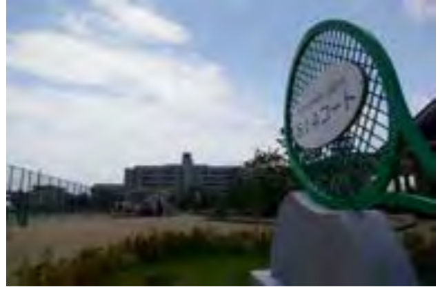
会場は小松市S・フォーティーンコート