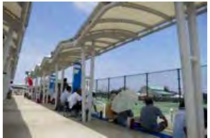
青空と爽やかな風