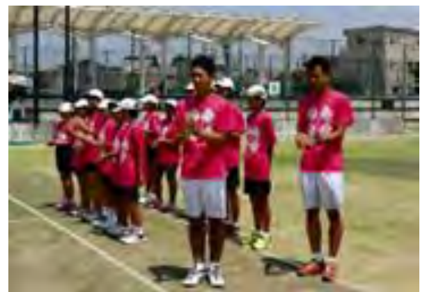
賞賛された審判とボールパーソン