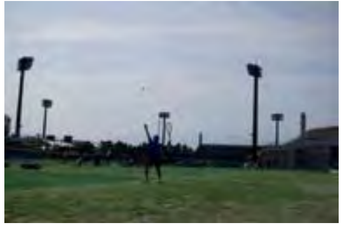
ダブルスはどの試合もハイレベルな闘い