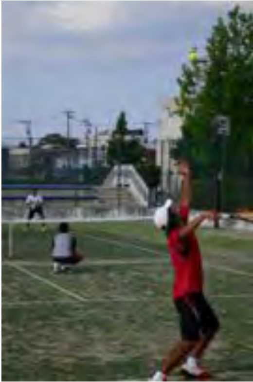
アイフォーメーションで攻める